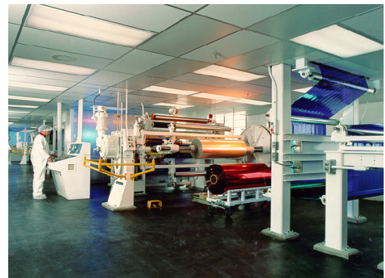
艺术级的涂覆生产线，帮助客户增强自身竞争优势。